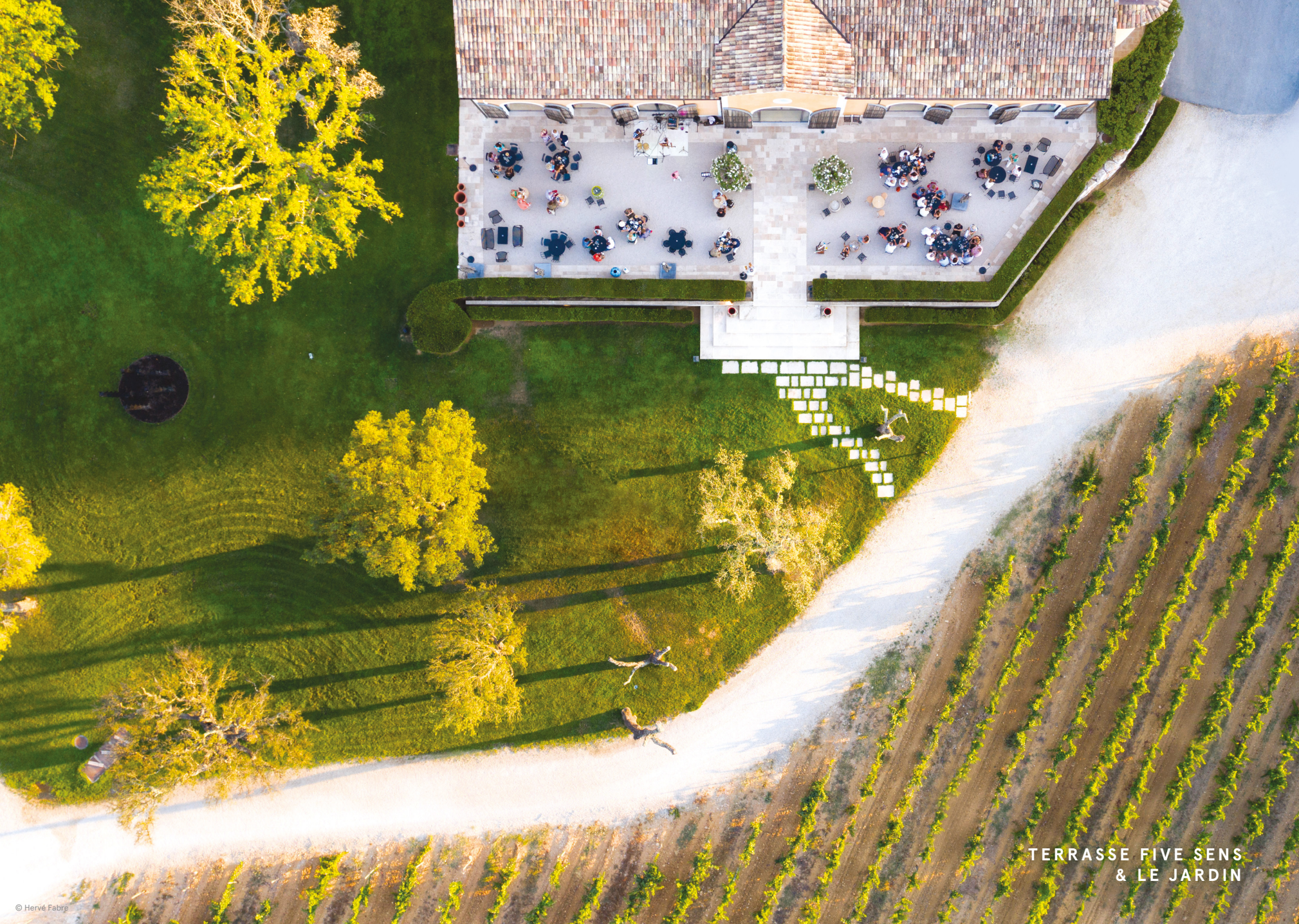
TERRASSE FIVE SENS & LE JARDIN